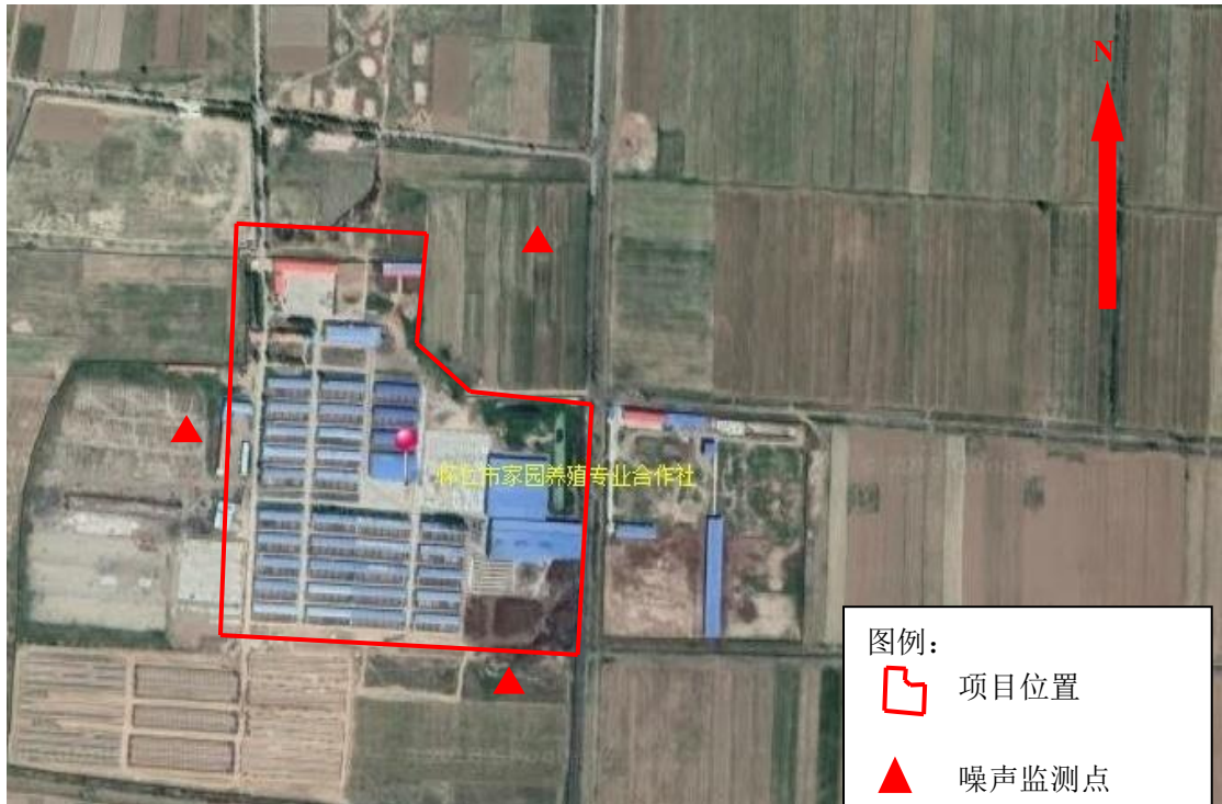
图 3-3 噪声监测点位示意图