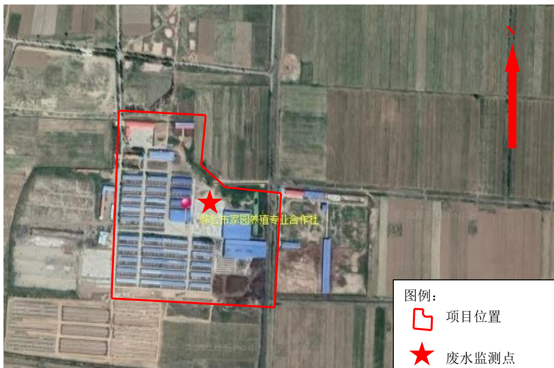
图 3-2 废水监测点位示意图