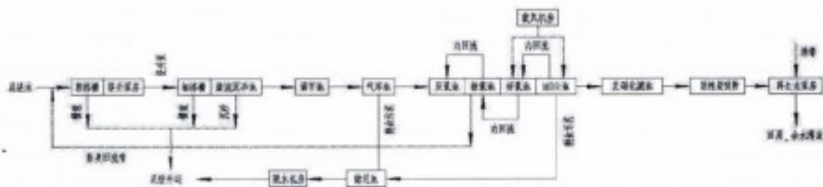
图 1-1 工艺流程图