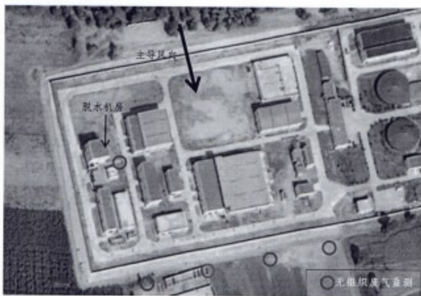
图 3-1 厂界无组织废气监测点位示意图