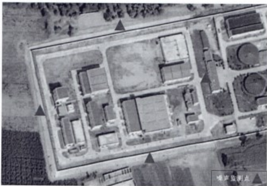
图 3-4 噪声监测布点示意图