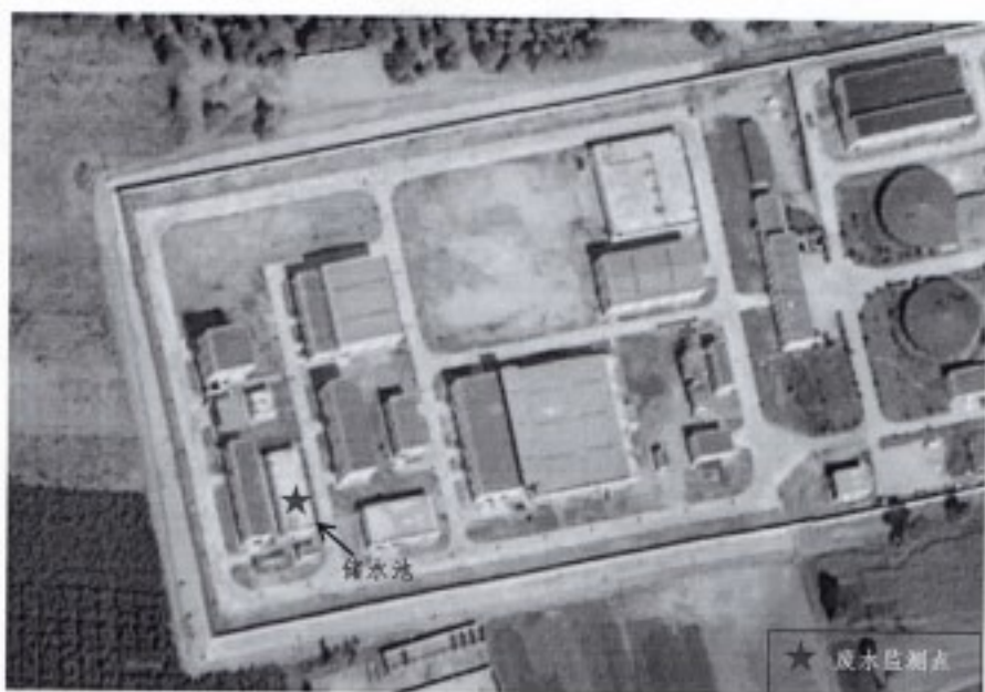
图 3-2 废水监测点位示意图