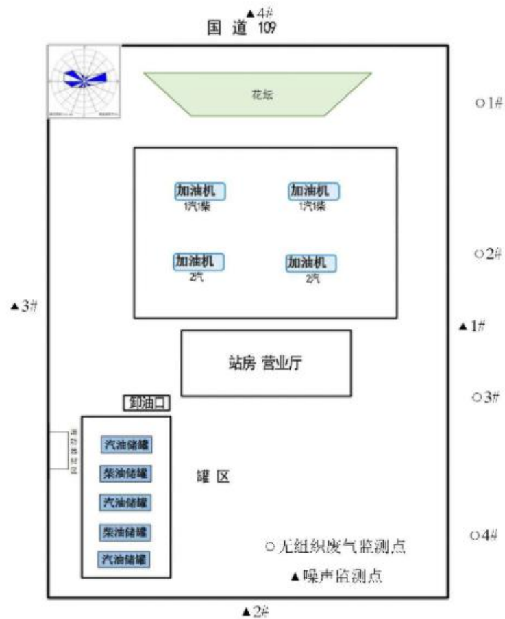
右玉上堡加油站监测布点图