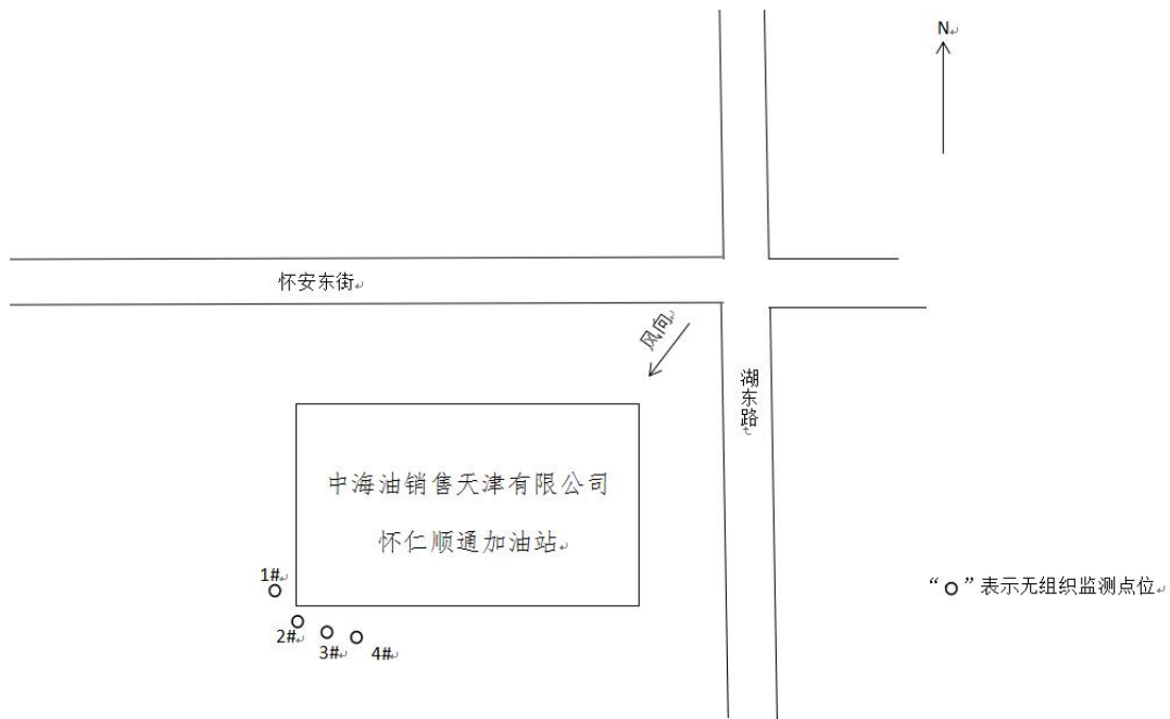
图 3-1 厂界无组织废气手工监测点位示意图（以监测期间主导风向为主）