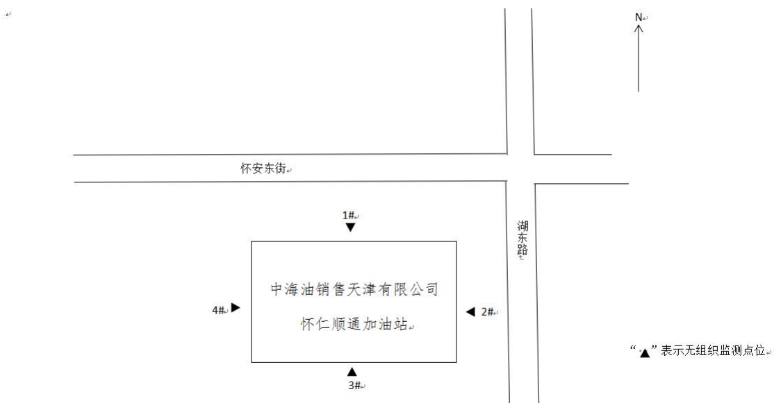
图 3-2 噪声监测点位示意图