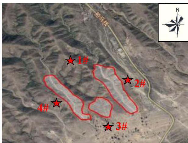
图 3-2 厂界噪声监测布点示意图