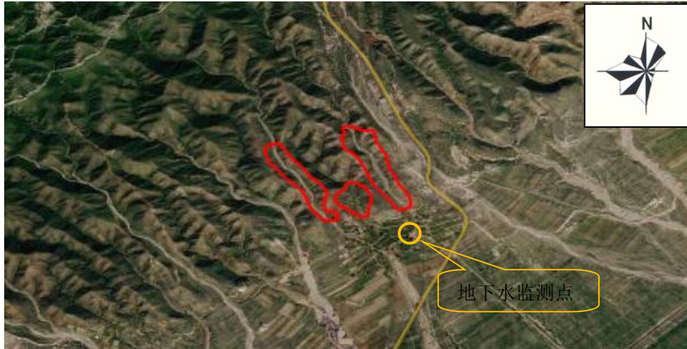
图 3-3 地下水监测布点示意图