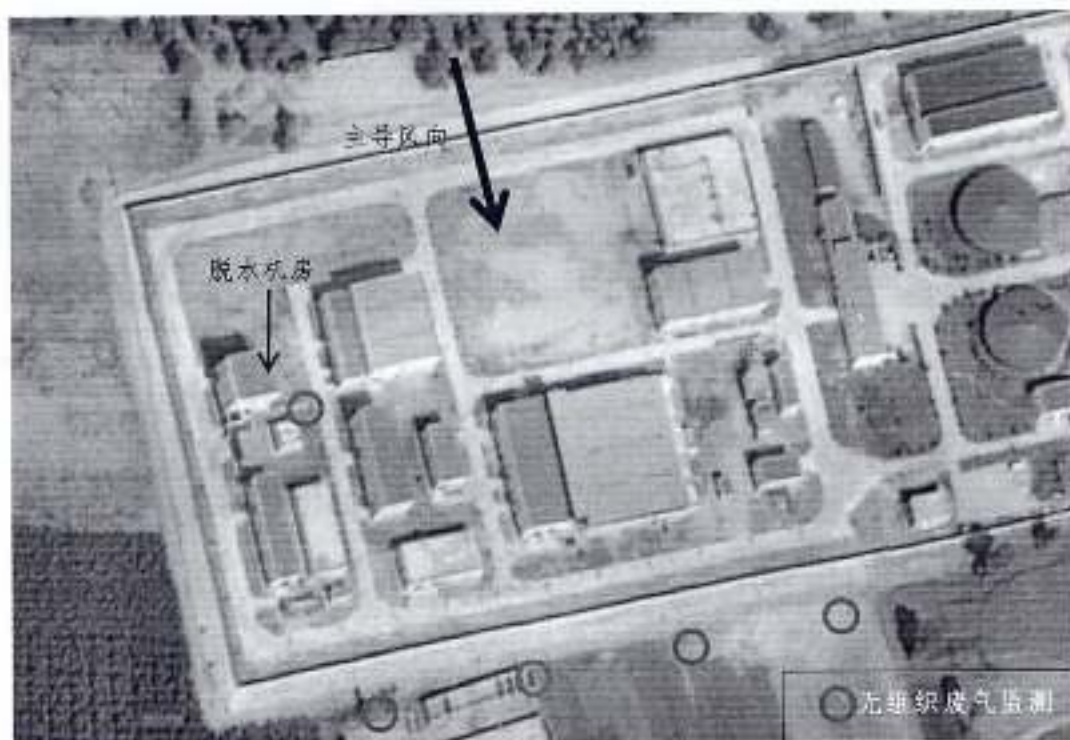
图 3-1 厂界无组织废气监测点位示意图