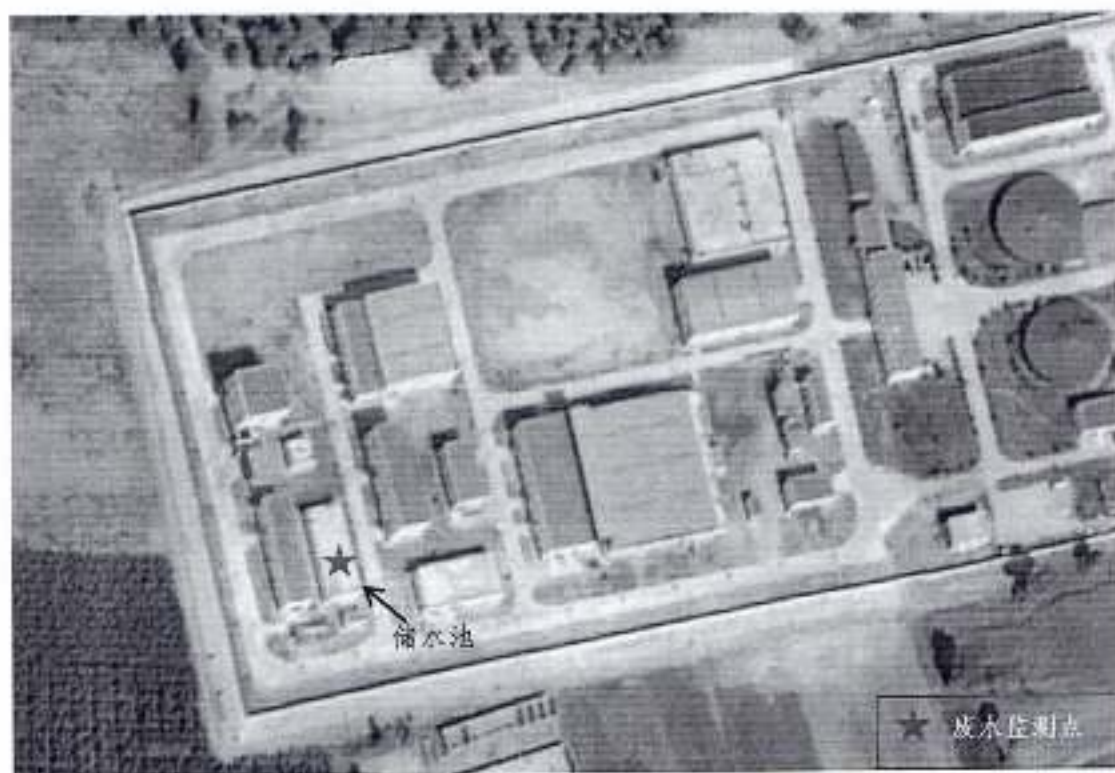
图 3-2 废水监测点位示意图