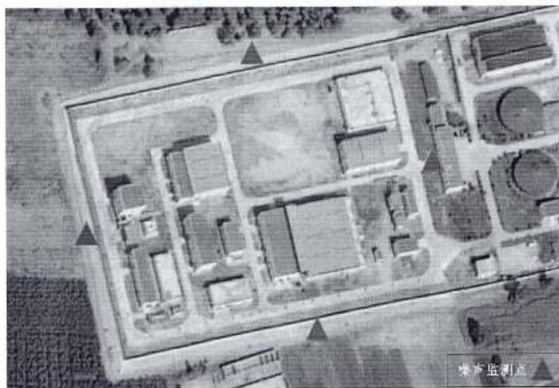
图 3-4 噪声监测布点示意图