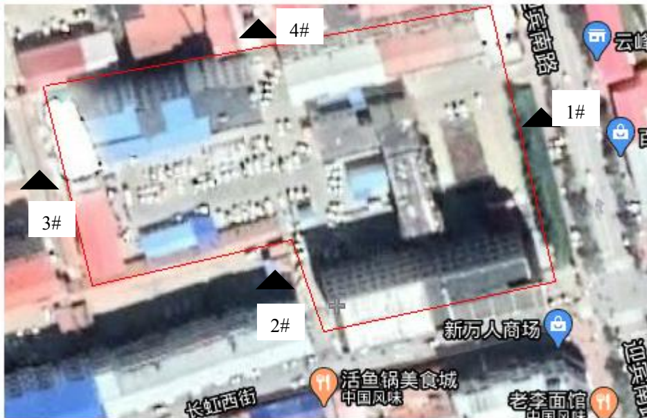
图 3-3 厂界噪声监测点位示意图