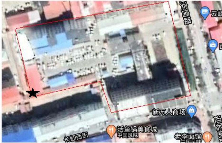
图 3-2 废水监测点位示意图