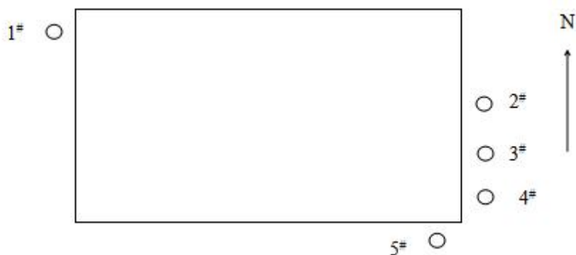
图 3-1 厂界无组织监测点位示意图