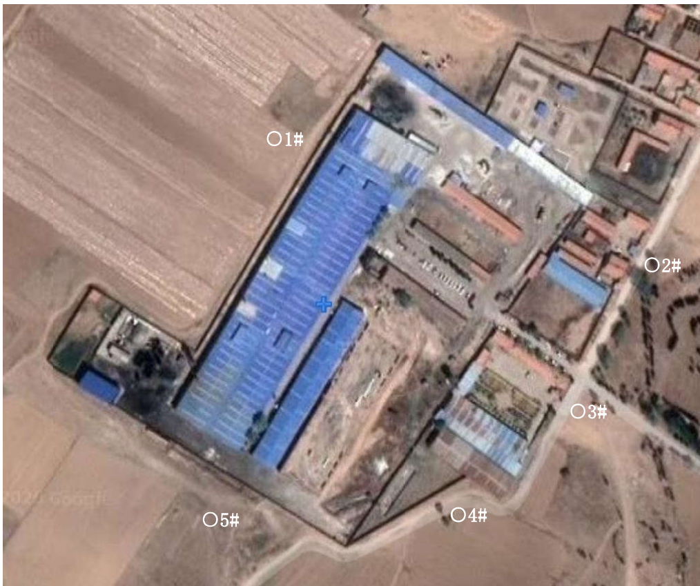
厂界无组织手工监测点位示意图