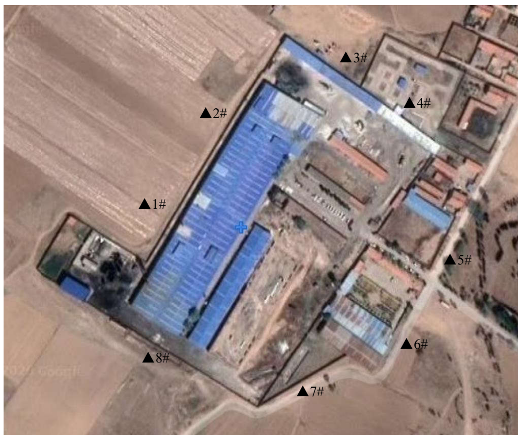
厂界噪声手工监测点位示意图