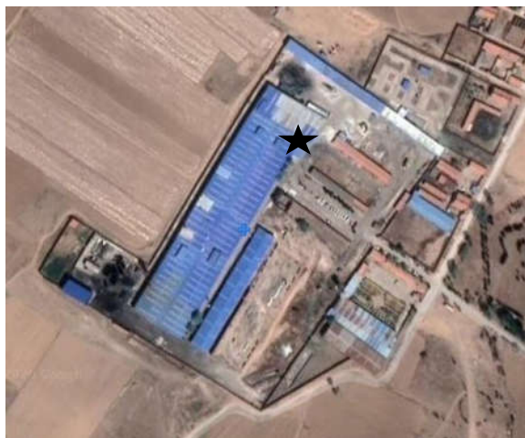
生产废水手工监测点位示意图